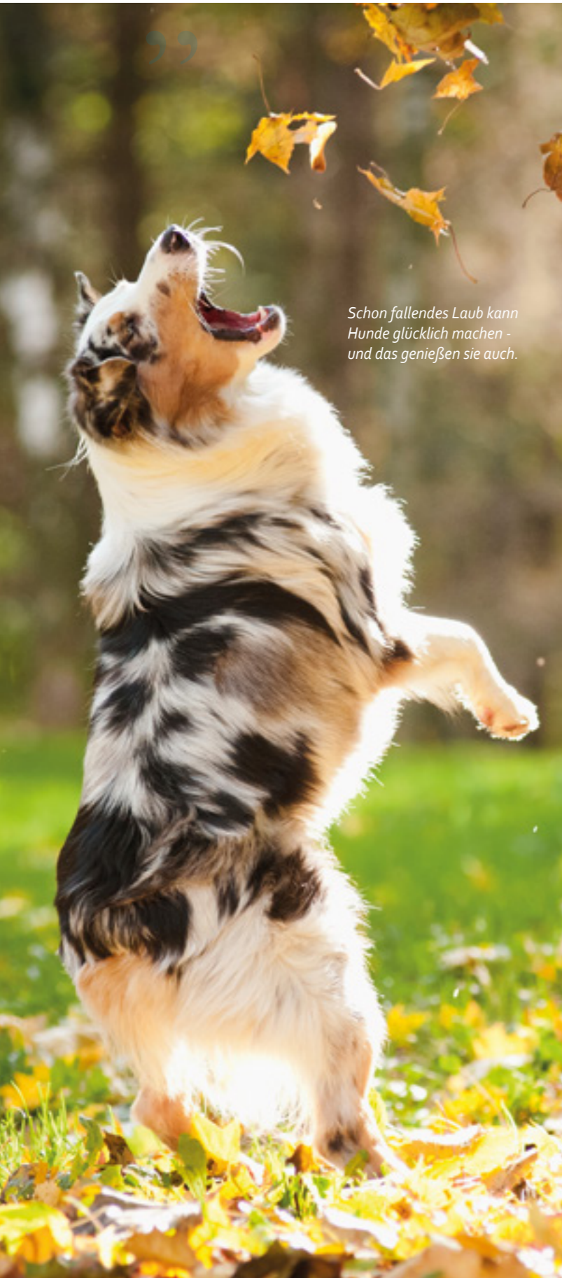
Schon fallendes Laub kann Hunde glücklich machen - und das genießen sie auch.

ein Lächeln der am leichtesten zu erkennende Gesichtsausdruck ist. Neugeborene Kinder reagieren sogar auf gezeichnete, lachende Smileys (McConnell, 2005). Wir unterscheiden uns hingegen hinsichtlich des langanhaltenden „in die Augen starren“, welches Hunden schnell unangenehm erscheint. Zwar wird – sofern eine gesunde Mensch-Hund-Beziehung vorhanden ist – auch bei einem direkten Blickkontakt das Bindungshormon Oxytocin ausgeschüttet, achten Sie aber dennoch darauf, sich kein Blickduell mit Ihrem oder gar fremden Hunden zu liefern. Verliebte, glückliche Menschen sehen sich gerne stundenlang an und empfinden Wärme und Geborgenheit. Unseren Hunden hingegen wird es schnell zu unangenehm, da das Anstarren Situationen verschärfen kann – besonders unter Hundegruppen, in welchen sich die Individuen erst richtig einschätzen lernen müssen, ehe sie davon ausgehen können, dass ein direkter Blickkontakt nicht zwangsläufig herausfordernd gedeutet werden muss.