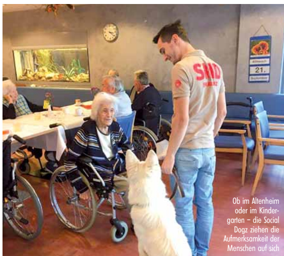
Ob im Altenheim oder im Kindergarten – die Social Dogz ziehen die Aufmerksamkeit der Menschen auf sich